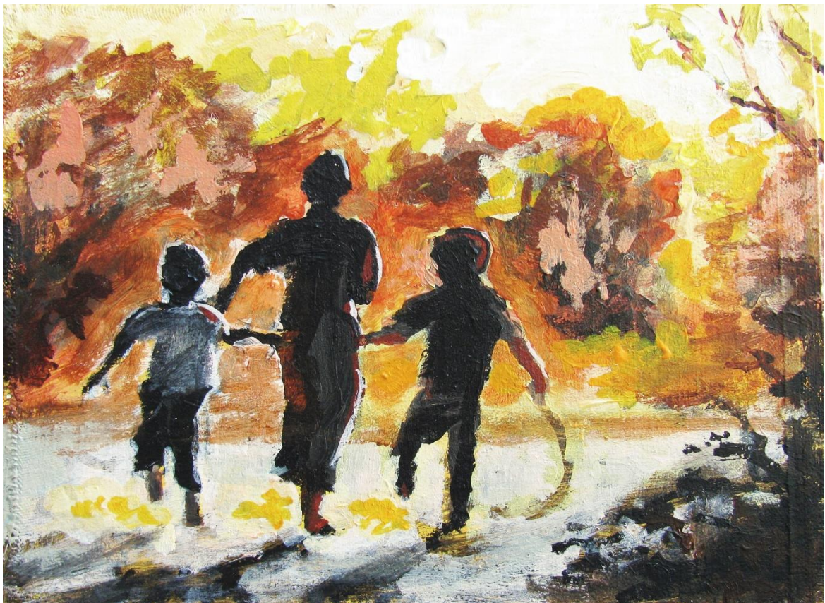
© Michel Elias, La course à trois, 2009.

Nous avons commencé notre parcours avec un passage des Actes des Apôtres. Aujourd'hui, y revenant, nous (re)découvrons que les relations fraternelles peuvent faire en sorte que nul ne soit dans le besoin. Et avec saint Paul, que notre sororité-fraternité se fonde dans le baptême qui fait que tous, nous ne faisons « plus qu'un dans le Christ Jésus ». Voilà, en effet, « ce que proclame le baptême qui n'est pas d'abord un acte d'Eglise, mais une prédication de la part de l'Éternel qui met en évidence notre valeur intrinsèque, quelle que soit notre histoire personnelle, quel que soit notre parcours, quelles que soient nos défaillances et nos réussites. »